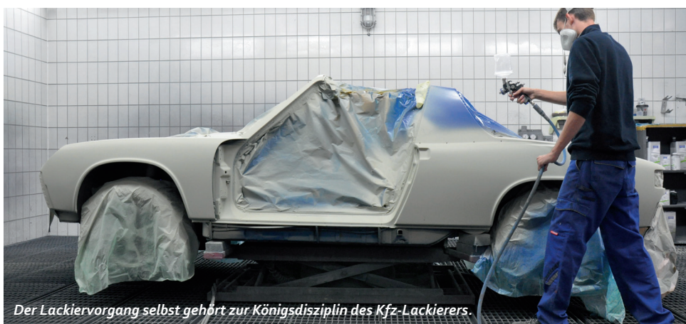
Der Lackiervorgang selbst gehört zur Königsdisziplin des Kfz-Lackierers.

Sie sind die Künstler der Automobilbranche und darauf spezialisiert, Karosserien zu lackieren, Lackschäden zu beheben und manchmal mit Phantasie zu designen . Das erste Ausbildungsjahr spielt sich wie bei fast allen Kfz-Berufen in der Schule ab, der Azubi ist einen Tag pro Woche im Betrieb. Zu den Hauptaufgaben gehört das Schleifen und Grundieren von Oberflächen und das Mischen der richtigen Farbe. Diese wird in vielen dünnen Lackschichten auf das Fahrzeug aufgetragen. Das erfordert sehr viel Geschick und Geduld .