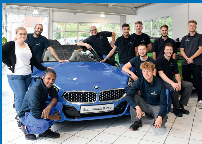
Unser Azubiteam des Jahrgangs 2022/23